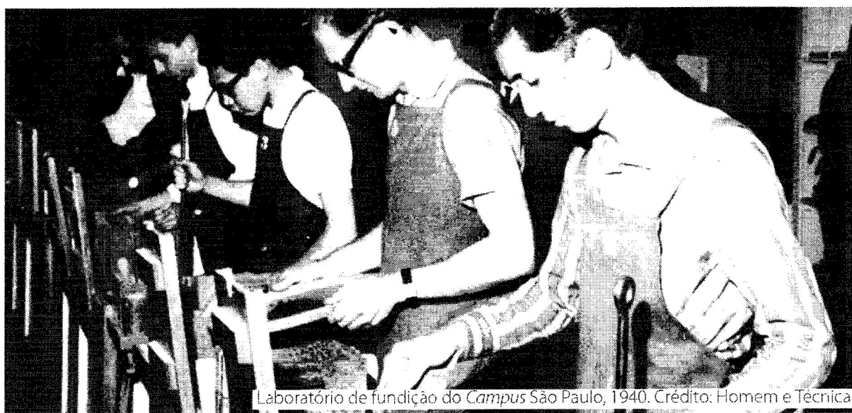
Laboratório de fundição do Campus São Paulo, 1940.