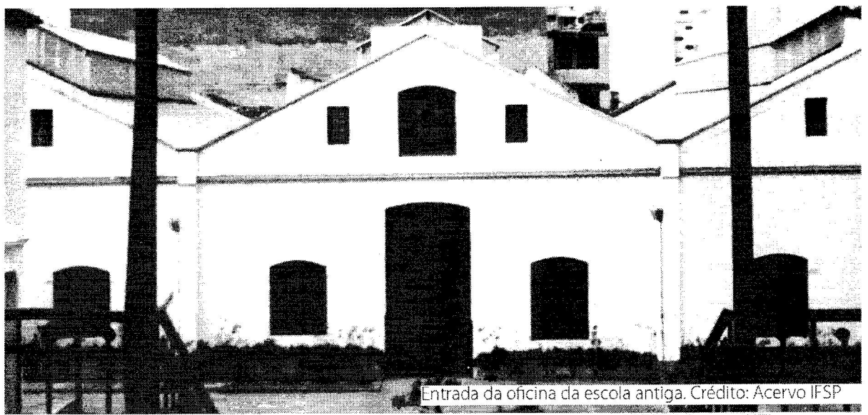
Entrada da oficina da escola antiga.