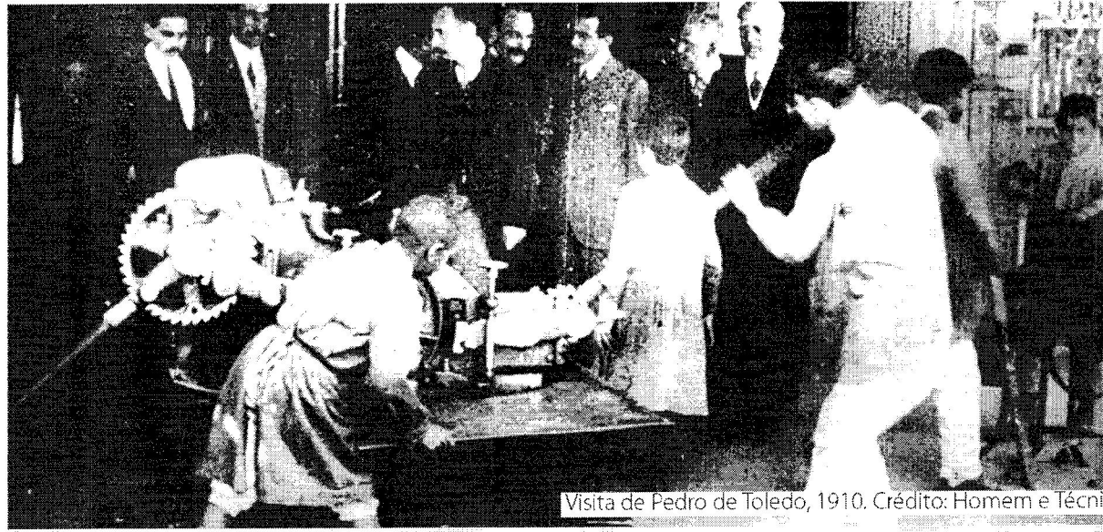
Visita de Pedro de Toledo, 1910.