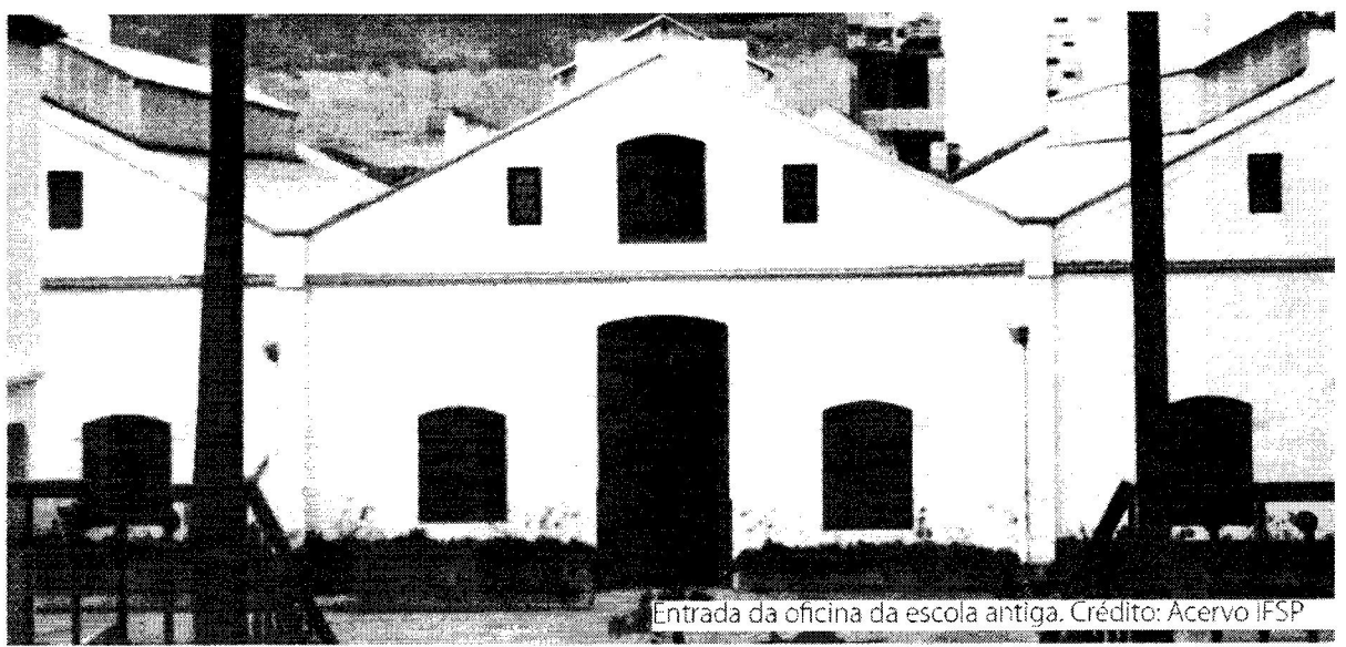
Entrada da oficina da escola antiga.