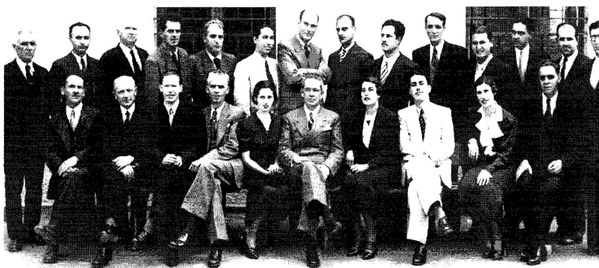
Corpo docente da Escola em 1945.