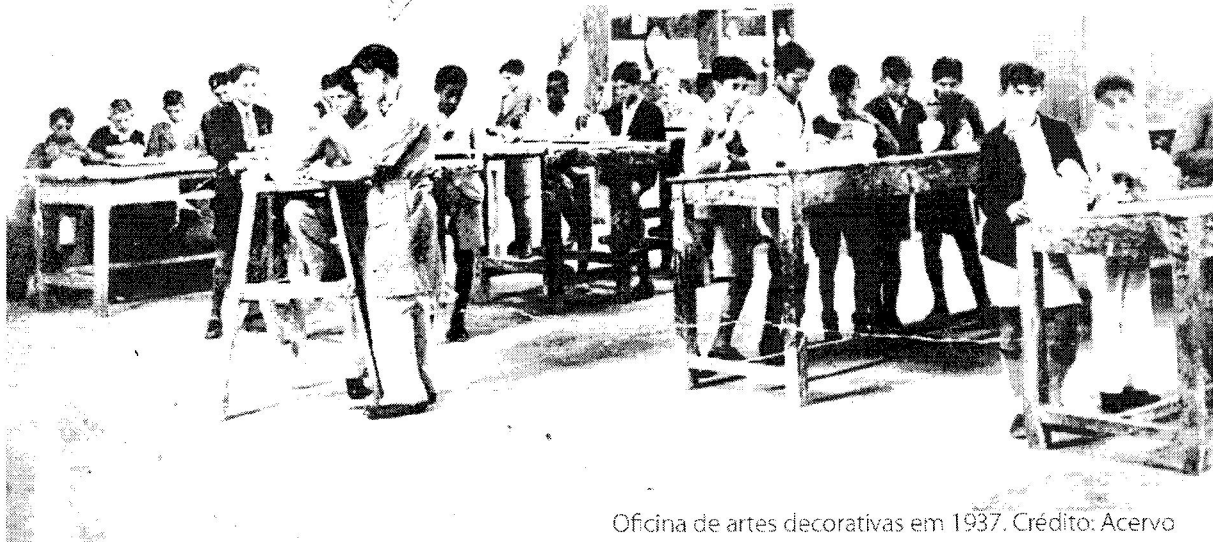
Oficina de artes decorativas em 1937.