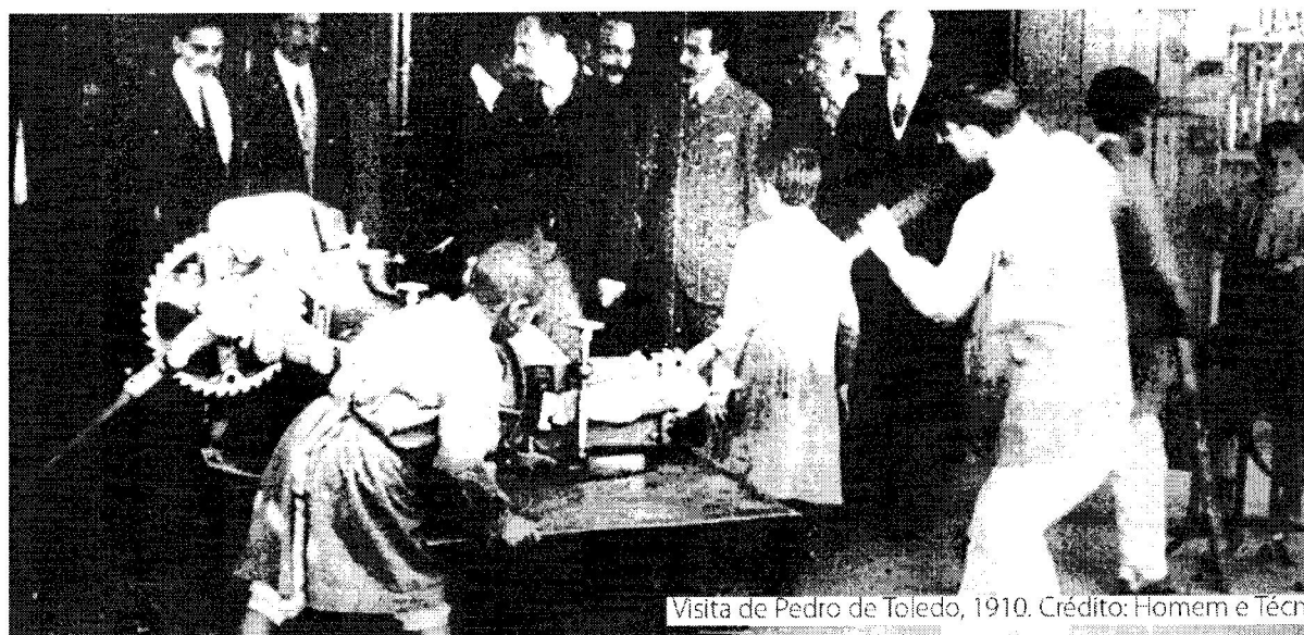
Visita de Pedro de Toledo, 1910.