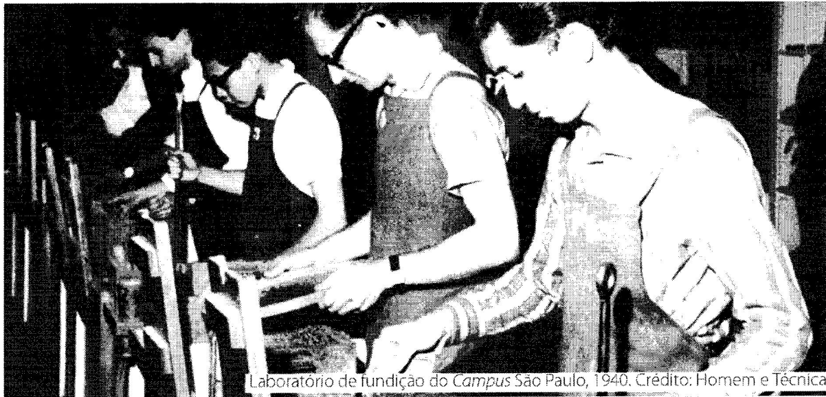
Laboratório de fundição do Campus São Paulo, 1940. Crédito: Homem e Técnica