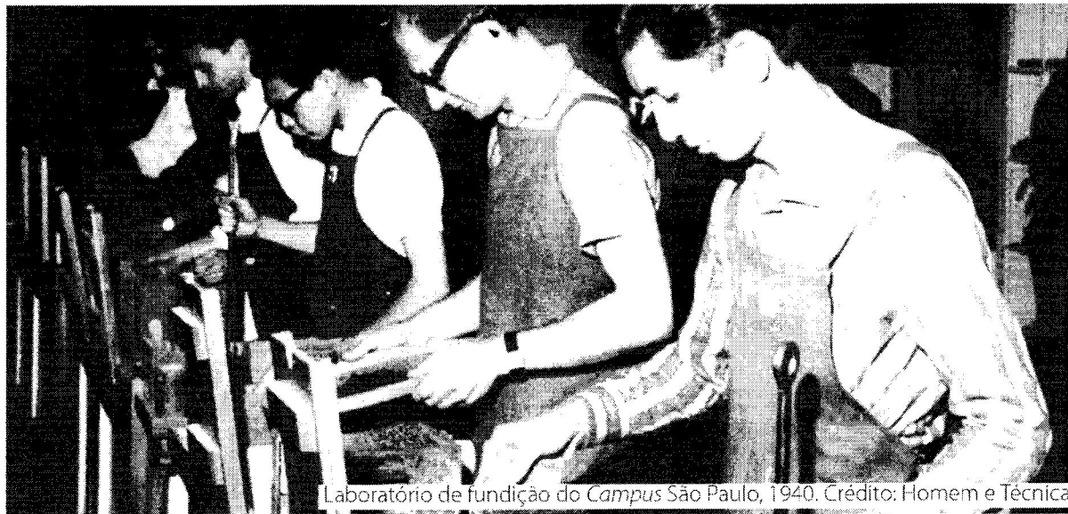
Laboratório de fundição do Campus São Paulo, 1940.