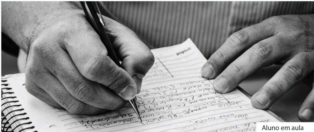
Aluno em aula