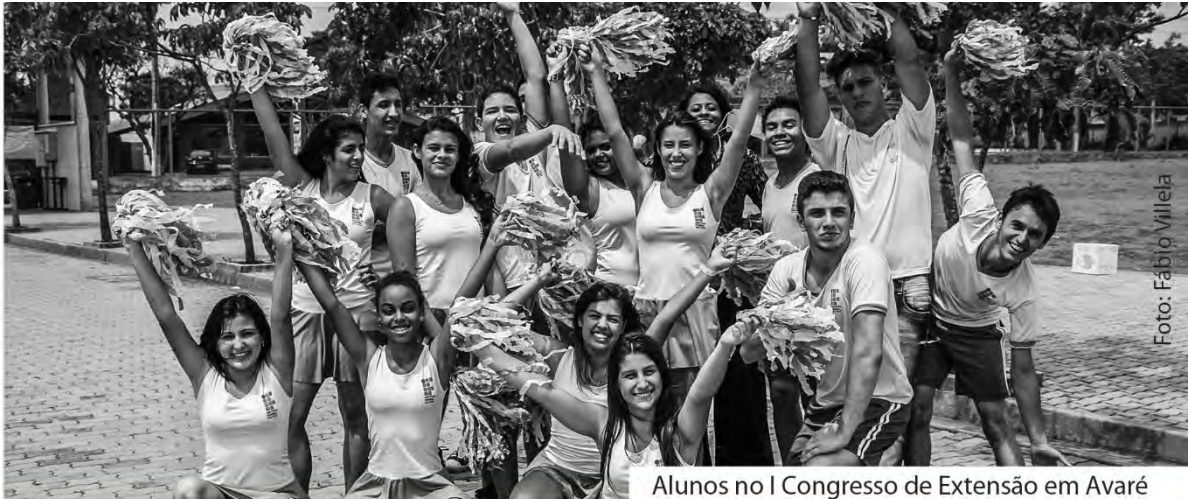
Alunos no I Congresso de Extensão em Avaré