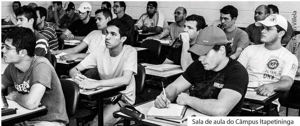
Sala de aula do Câmpus Itapetininga